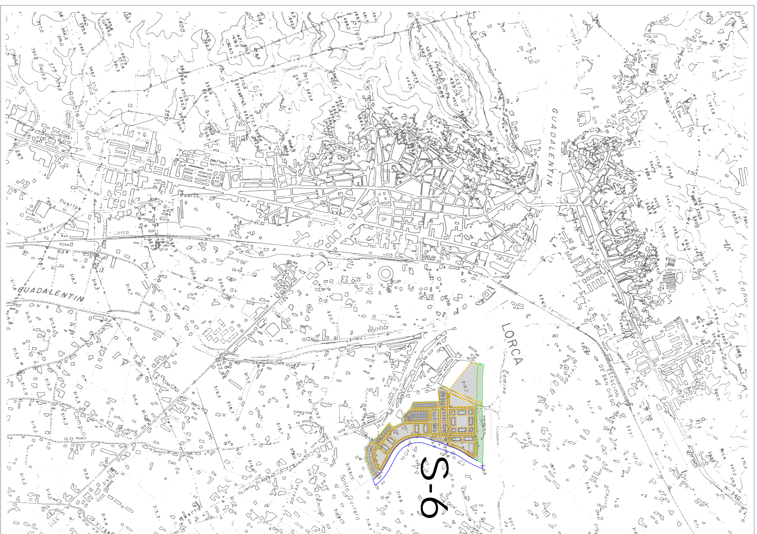
SITUACIÓN RESPECTO AL TERRITORIO